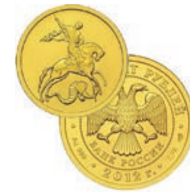
Золотая монета «Георгий Победоносец»

Поскольку речь зашла о пенсионерах, то, вероятно, стоит сказать несколько слов и о том, какие примерно нужны накопления, чтобы жить в преклонном возрасте без снижения своего уровня жизни. В предыдущих заметках уже отмечалось, что статистической российской семье для нормальной жизни требуется примерно унция золота в месяц. Пенсионный фонд ранее рассчитывал пенсию исходя из срока дожития в 19 лет. Возможно, сейчас что-то поменялось, но будем исходить из этого значения. 19 лет — это 228 месяцев, что соответствует 228 унциям золота или 912 «Георгиев Победоносцев». Эта величина может служить определенным ориентиром, как желательно иметь сбережения перед выходом на пенсию, чтобы не зависеть от произвола центрального банка и не задумываться над тем, какую пенсию будет платить государство, и куда бы вложить свои средства, чтобы получить хоть какую-то прибавку к мизерной пенсии.