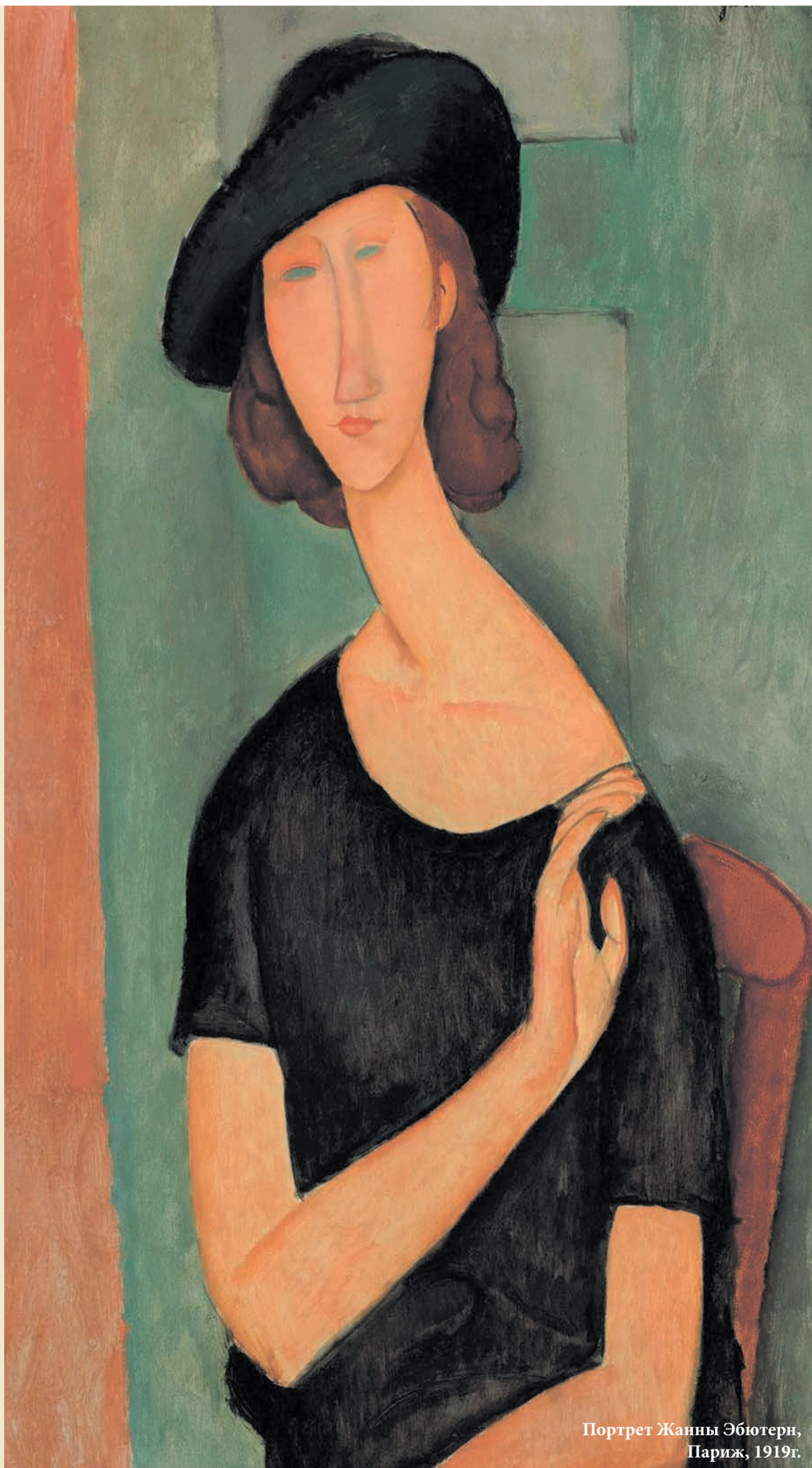
Портрет Жанны Эбютерн, Париж, 1919г.