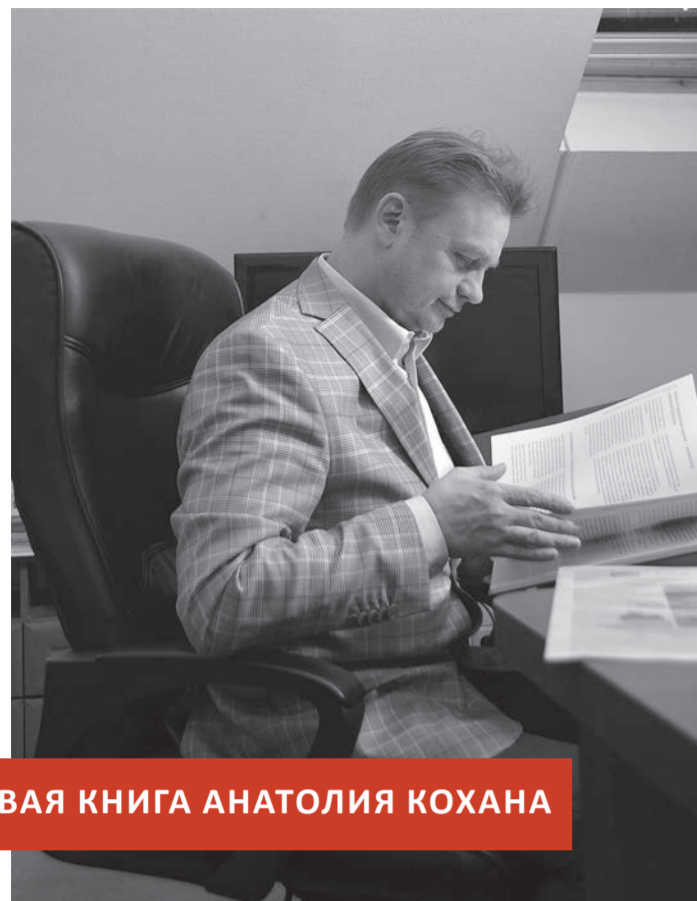
НОВАЯ КНИГА АНАТОЛИЯ КОХАНА